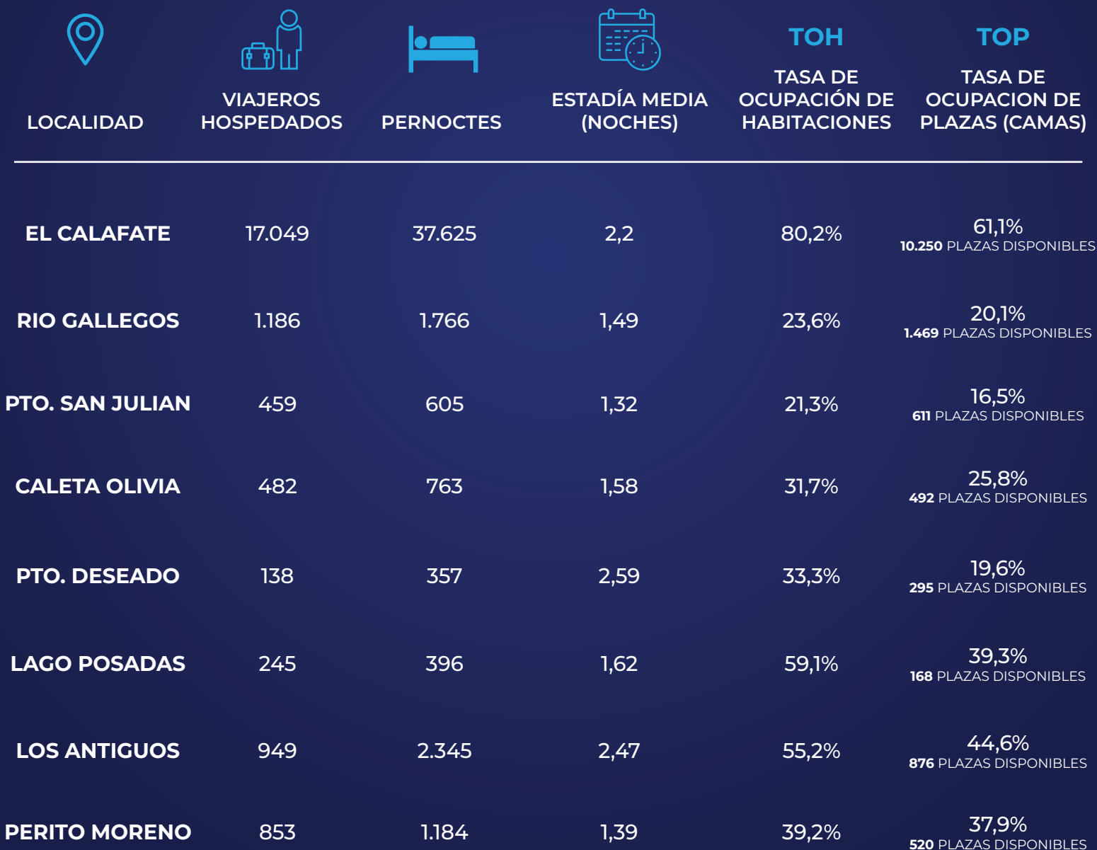
TABLA DE RESULTADOS